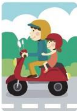
安全帽符合頭部大小 且扣緊扣環