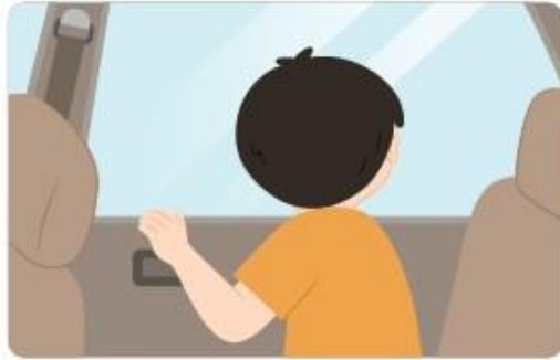
附件 1-23 安全開車門 說明圖