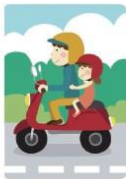
坐於後座且緊抱駕駛