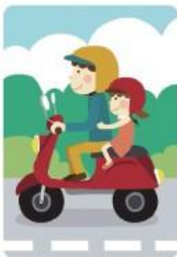
安全帽過大且 未扣上扣環